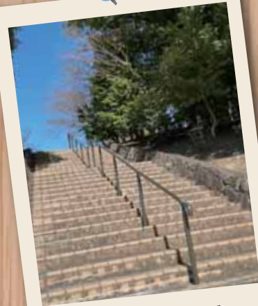
金剛東中央公園 階段への手すり設置