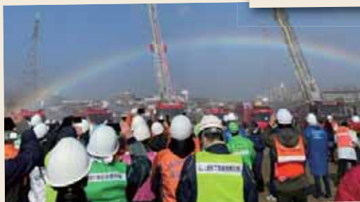
3年ぶりに開催された消防出初式

市議として3期目を務めさせて頂くようになってから早くも4年が経過しようとしております。 この間、多くの事を議会の場にて提案し、実現へと繋げて参りました。 なかでも、保育園からの使用済みの紙おむつの持ち帰りを無くせたこと、金剛地域の新たなまちづくりに向け、長年の懸案であったピュア金剛あとの方向性が決まったことなど、私の提案の根底には市民の皆さんからの貴重なご意見や、ご相談があります。 これからも皆さんとともに、この富田林市をさらに良くしていくために歩んで参りたいと思っておりますので、引き続きましてのご指導、ご鞭撻のほど、よろしくお願ひ申し上げます！