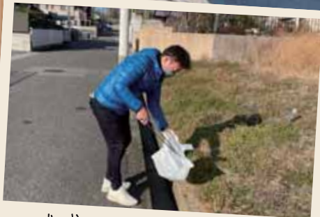
地域のクリーン活動に参加