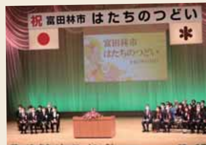
はたちのつどい (旧成人式)